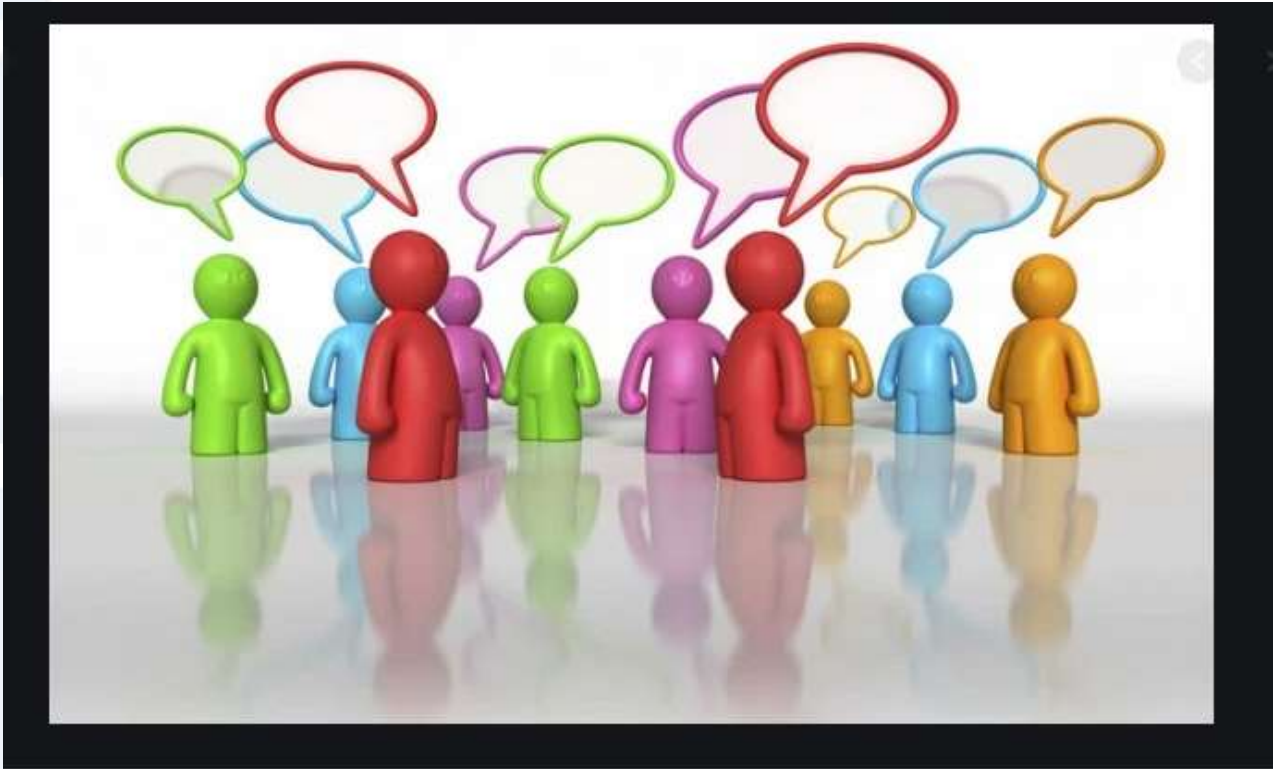
Grafica Nro 01

análisis anterior e indican que los encargos de carrera administrativa, el entrenamiento en el puesto de trabajo, la comunicación e integración y el medio ambiente físico, son aspectos a los que la entidad debe intervenir.