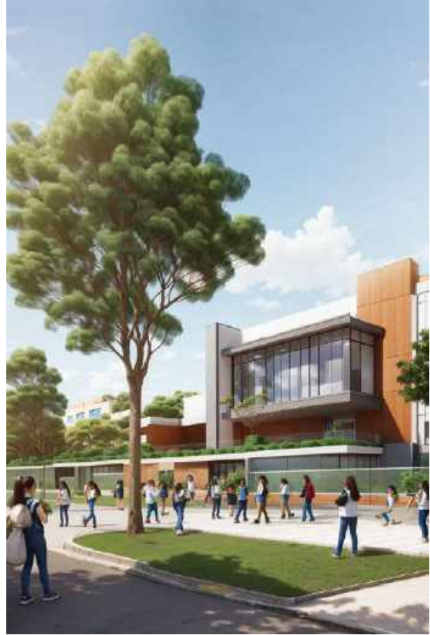
Imagen de referencia megacoledios en Itagüí.

✓ Gestionaremos con el Gobierno Nacional y el Área Metropolitana del Valle de Aburrá los recursos necesarios para la construcción de nueva infraestructura educativa, a través de la cual dejaremos atrás el déficit existente de metros cuadrados por estudiante en el aula, lo cual nos permitirá implementar en un setenta (70 %) la estrategia de Jornada Única en Itagüí para el año 2027. A su vez, un porcentaje tan importante de implementación nos permitirá ampliar las horas destinadas a formación integral cognitiva, socioemocional y ciudadana, a través de programas diversificados que aprovechen los laboratorios, bibliotecas, centros de cómputo y espacios deportivos de cada uno de los colegios. En igual sentido, un transparente ejercicio de contratación y supervisión nos permitirá tener uno de los mejores modelos de alimentación escolar de Colombia, tanto en cobertura como en calidad de los alimentos, lo cual impactará positivamente