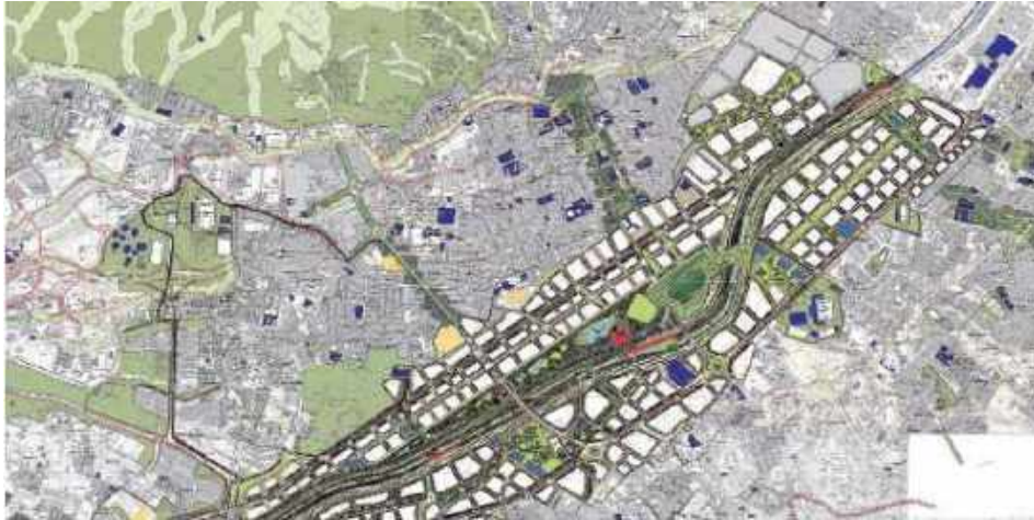
Imagen del Modelo de Ocupación propuesto para la Centralidad Sur - (AMVA, 2009) en el que se destaca que el Municipio de Itagüí es el que tiene la mayor participación de metros cuadrados dentro del polígono de normatización de terminado, equivalente al 35 % del total de metros cuadrados delimitados, en el que se contempla la densificación urbana del entorno del Río Medellín y el desarrollo de un parque metropolitano y un área de equipamientos de diversa escala.

la inteligencia artificial, al tiempo que se promueva la interacción armónica de las diferentes actividades económicas y usos del suelo, con otros destinados a servicios y vivienda, en pro del mejoramiento de la calidad de vida de todos los habitantes de la Itagüí.