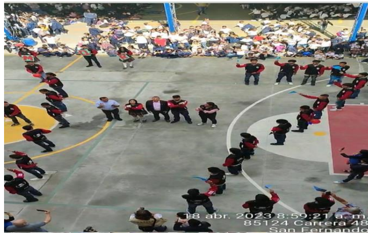
Escuela Municipal de Derechos Humanos, capacitación Estudiantes I.E Marceliana Saldarriaga